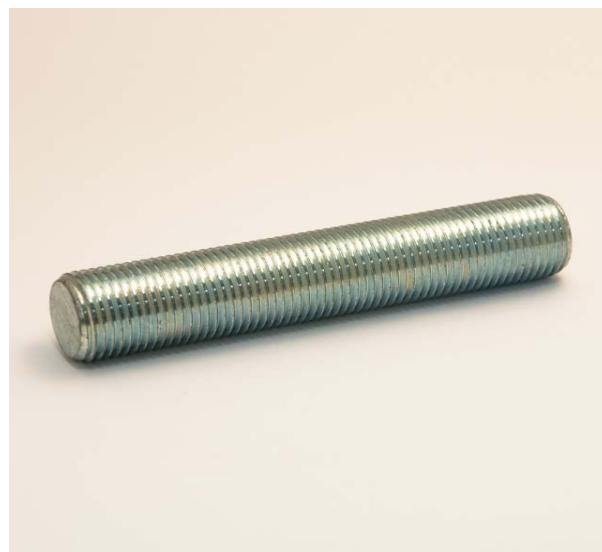
Zincatura elettrolitica bianca