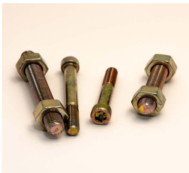
Zincatura elettrolitica gialla