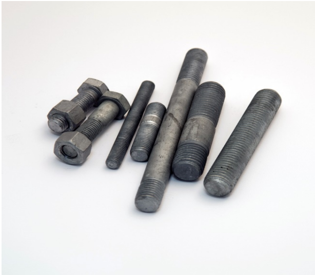
Zincatura a caldo