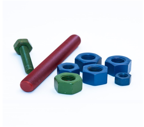
Teflonatura - PTFE